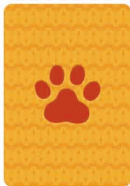
カード (小) ×49